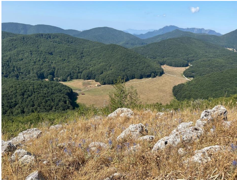
Piano Verteglia dal Monte Sassosano (1438 m)

E gli Accompagnatori di Escursionismo della Campania